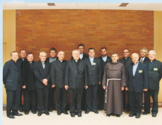
Stowarzyszenie Misjologów Polskich, Katowice 2007