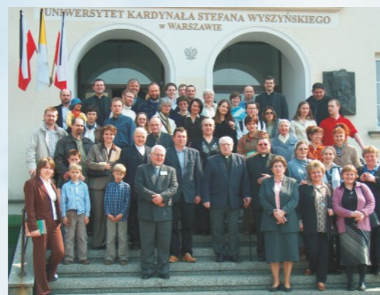
Zjazd absolwentów misjologii z okazji 35-lecia misjologii na UKSW, Warszawa 2005